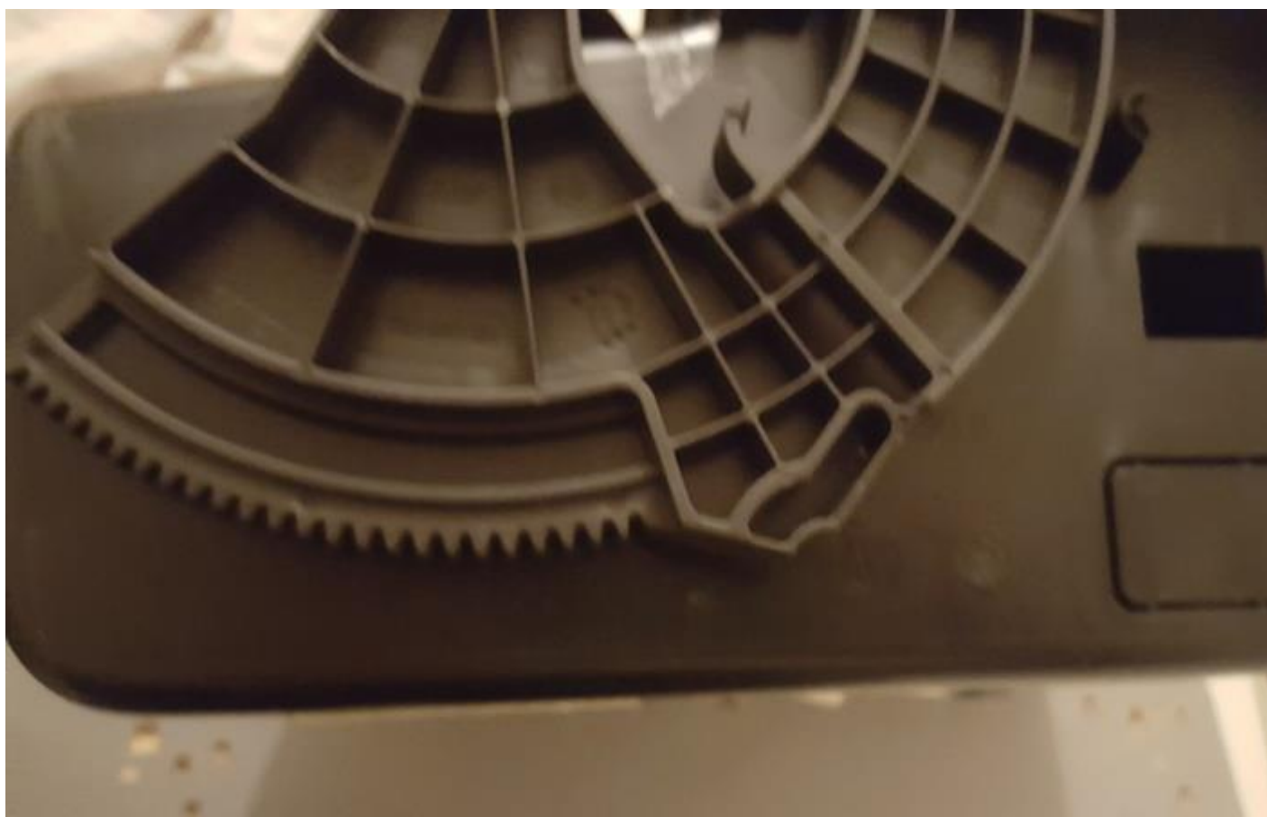
Celle de Zam